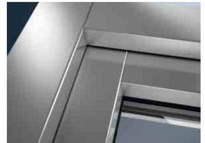
Erstklassige Gestaltungsvielfalt für Kunststoff-Fenster

Kunststoff-Fenster verfügen über die höchsten Wärmedämmstandards. Mit ihnen reduzieren Sie Ihre Heizkosten wesentlich, schonen dauerhaft Ihren Geldbeutel und leisten einen Beitrag zum Umweltschutz.