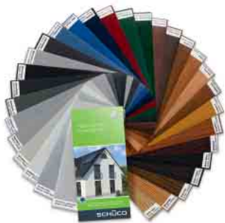
Schüco Farb- und Holzdekore