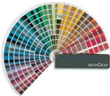
RAL- und Eloxal-Farben