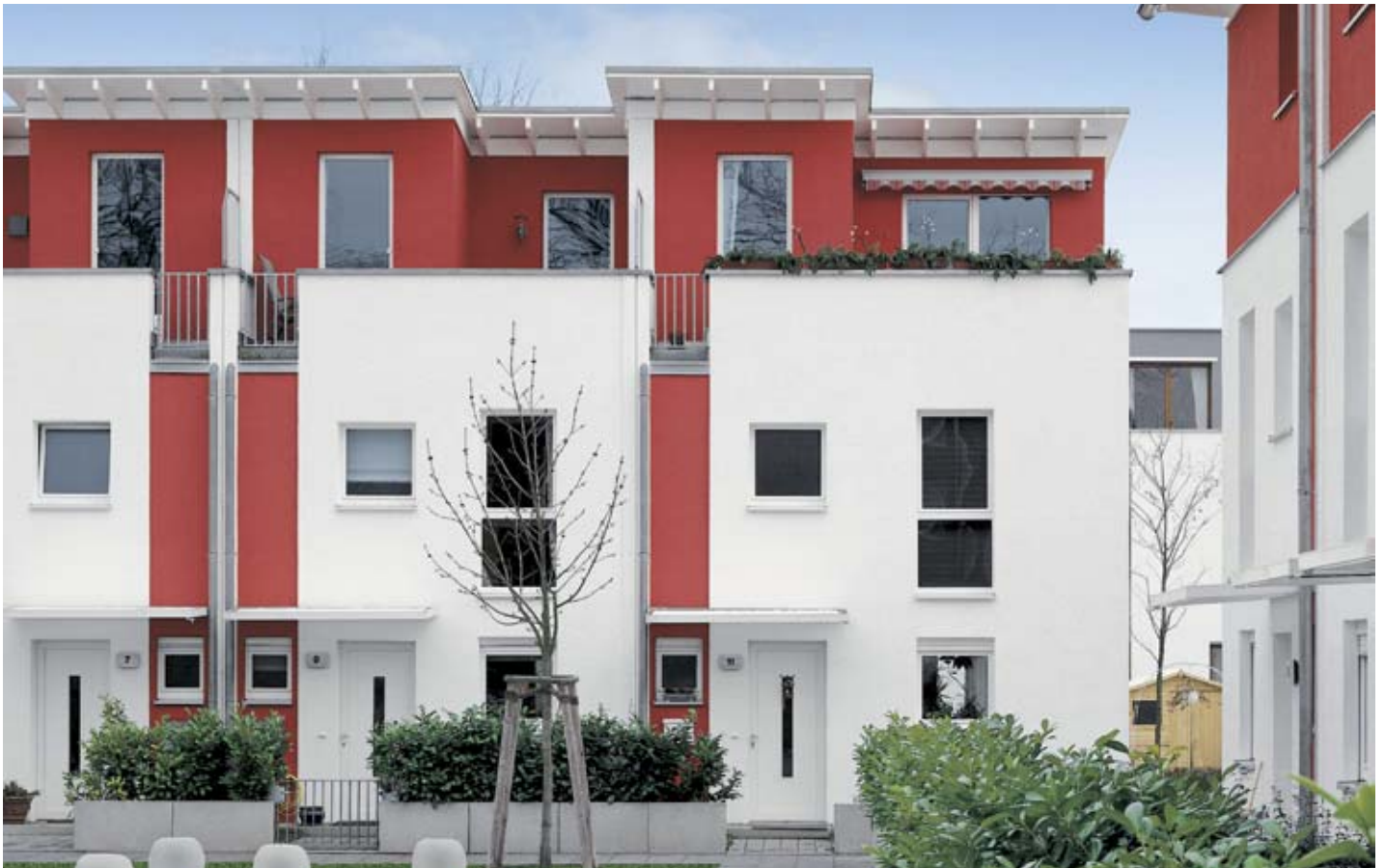
Schweizer Viertel, Berlin, Deutschland Swiss quarter, Berlin, Germany

Ob Gewerbeimmobilie oder Wohnobjekt, Neubau oder Renovation – der individuelle Charakter des Gebäudes wird maßgeblich durch sein Fassadenbild geprägt. Die Fassade oder besser, die Gebäudehülle, übernimmt die Rolle einer Funktionsschicht zwischen Umwelt und Gebäudeinnerem. Die Art, Ausführung und Beschaffenheit dieser Funktionsschicht bestimmt weitgehend die Aufenthaltsqualität und die Sicherheit für die Gebäudenutzer. Mit der Vielfalt der Schüco Kunststoff-Systeme lassen sich Lösungen realisieren, die jedem Objekt in puncto Ästhetik und Funktionalität einen unverwechselbaren Charakter verleihen – unabhängig von Typ, Größe und Nutzung der Immobilie. Auf den folgenden Seiten sind die wichtigsten Informationen zusammengefasst.