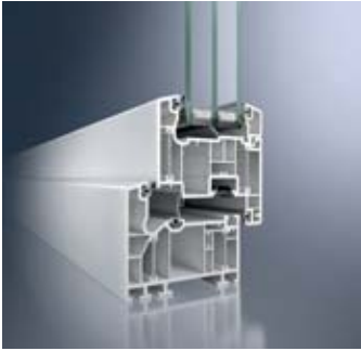
Schüco Alu Inside

Schüco entwickelt hochwertige Kunststoff-Systeme, die hinsichtlich Pflege, Wartung und Langlebigkeit hohe Maßstäbe im Hinblick auf die Wirtschaftlichkeit setzen. Die Basis ist hochwertiges, umweltfreundlich stabilisiertes PVC-U, aus dem die Schüco Kunststoff-Systeme gefertigt werden. Das Material ist sehr licht- und witterungsbeständig, schlagfest und auch bei höheren Temperaturen äußerst formbeständig. Konsequenz: Der Wartungsaufwand und damit auch Folgekosten für die Instandhaltung von Schüco Kunststoff-Systemen reduzieren sich auf ein Minimum. Zudem sind alle Schüco Kunststoff-Profile vollständig recyclebar.