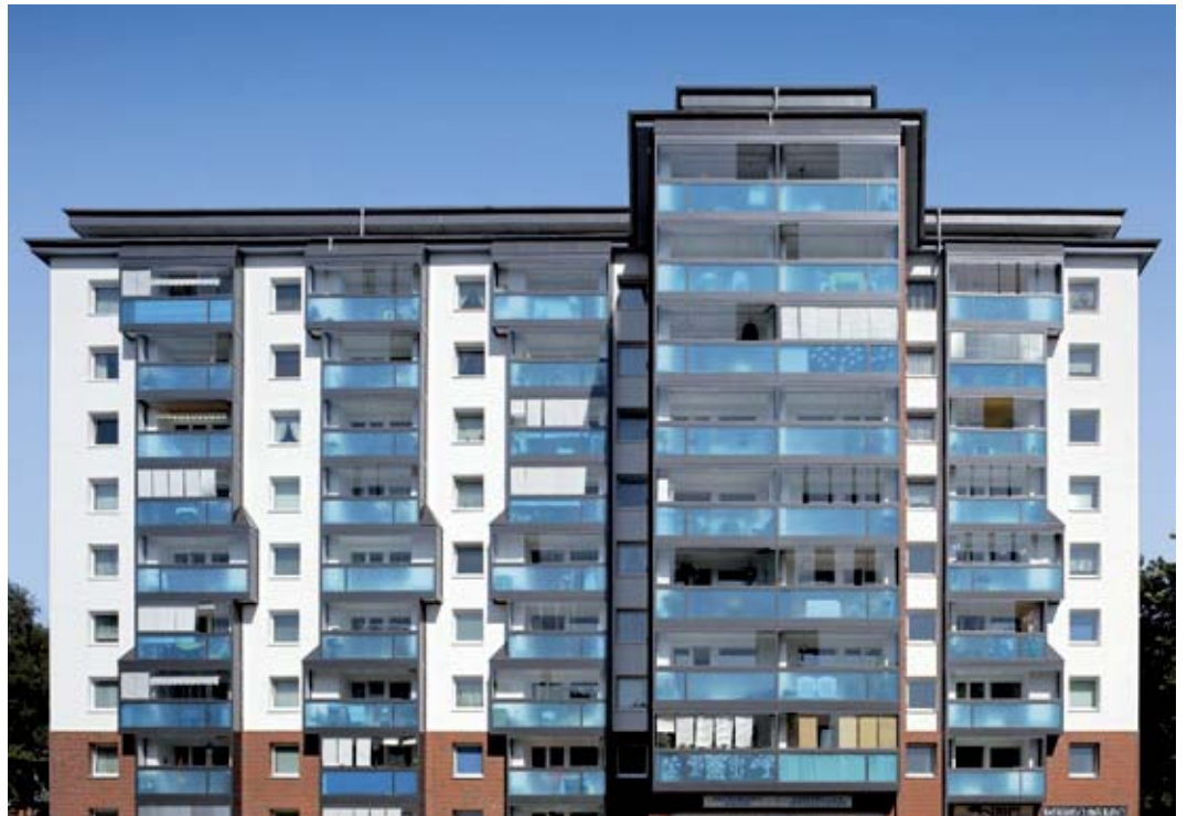
Mehrfamilienwohnhaus in Hamburg, Deutschland Apartment block in Hamburg, Germany

Die Schüco Kunststoff-Systemwelt besticht durch ausgereifte Systemtechnik, Profilkompatibilität zwischen den Systemen sowie Minimierung der Teilevielfalt. Dadurch profitieren Schüco Partner von einer einfachen Arbeitsvorbereitung, einer Maximierung der Produktqualität sowie der Minimierung ihrer Lagerbestände.