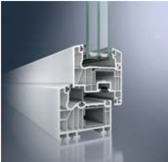
Schüco Corona SI 82 Classic

Schüco develops high quality PVC-U systems which set new standards in terms of cost-effectiveness when it comes to care, maintenance and durability. The basis is high quality, environmentally friendly, stabilised PVC-U from which the Schüco PVC-U systems are fabricated. The material is highly resistant to light, weathering and impacts and extremely resistant to deformation even at higher temperatures. The result is that the amount of maintenance required and therefore also the follow-up costs for servicing the Schüco PVC-U systems are reduced to a minimum. All Schüco PVC-U profiles are also fully recyclable.