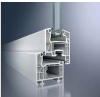
Schüco Corona CT 70 AS Classic