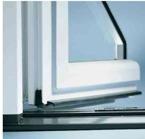
Die barrierefreie Türschwelle bietet Komfort, Sicherheit und Perfektion im Detail

Schüco Profile und Zubehörteile werden nach DIN EN ISO 9001 hergestellt und unterliegen einer strengen Qualitätsprüfung. Die Weiterverarbeitung von Schüco Profilen und Zubehörteilen durch Schüco Fachbetriebe findet gemäß den Richtlinien und Qualitätsstandards von Schüco statt.